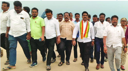
శిరిగి పునరుద్ధరించే దిశగా కూటమి ప్రభుత్వం జిల్లా అటవీ శాఖ అధికారి, అటవీ రేంజ్ అధికారులు ప్రయత్నాలు చేస్తుందని వివరించారు. ఎమ్మెల్యే వెంట పాల్గొన్నారు.

గాం, ఏప్రిల్ 28(వార్త): జిల్లాలో పశుపాలు పెంచడం ద్వారా పర్యావరణ పరిరక్షణకు పాటుపడవచ్చు అని రాష్ట్ర వ్యవసాయ శాఖ మంత్రి అచ్చం నాయుడు పిలుపుమేరకు శ్రీకాకుళం ఎమ్మెల్యే గోండు శంకర్ నగరవనం ఏర్పాటుకు సోమవారం స్థల పరిశీలన చేశారు. ఈ సందర్భంగా గార మండలం ఎస్.టి.మత్స్య శివోల్ అటవీ శాఖ అధికారులతో కలిసి ఎమ్మెల్యే పర్యటించారు. ముందుగా విశాఖ ఏ కాలనీలోని ఎమ్మెల్యే కార్యాలయనికి వచ్చి అటవీశాఖ అధికారులు ఎమ్మెల్యేను మర్యాదపూర్వకంగా కలుసుకున్నారు. అనంతరం నగర మహాలక్ష్మి చర్చిని అటవీ శాఖ అధికారులతో కలిసి ఎమ్మెల్యే శ్రీకార్యాలయమత్స్యశివోల్ ప్రాంతంలో పర్యటించారు. నగర మహాల అభివృద్ధి ద్వారా పర్యావరణ పరిరక్షణకు ఎంతగానో తోడ్పడుతుంది అన్నారు. జైవీ ప్రభుత్వ హయాంలో నగరమహాల పూర్తిగా కల కోల్పోయిందని, వాటిని