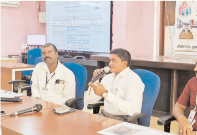
నుండి, 11 వరకు మూడు రోజుల పాటు నిర్వహిస్తున్నట్లు తెలిపారు.