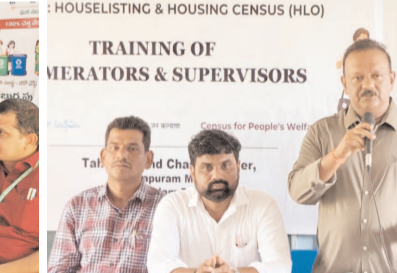
ఎమ్మెల్యేలకు మూడు విడతల్లో ప్రతి విడతలో మూడు రోజుల పాటు శిక్షణ ఇవ్వనున్నట్లు వివరించారు. జనాభా గణనలో తప్పులు లేకుండా జాగ్రత్తగా విధులు నిర్వహించాలని సూచించారు.