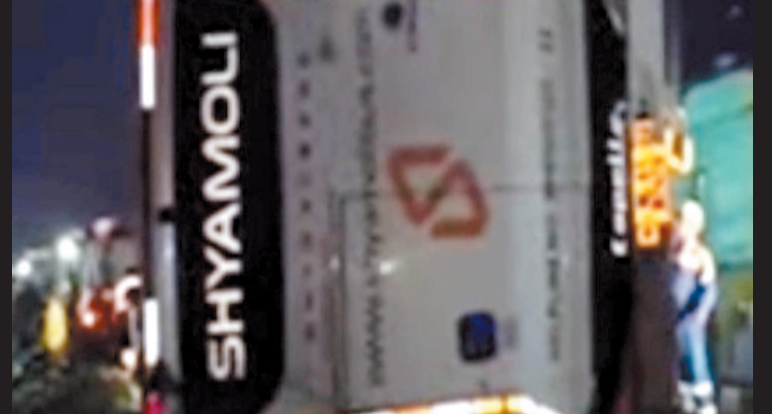
అప్పుడే గనుక ఆ మృత్యు శకటాలను అడ్డుకొని ఉంటే, ఈరోజు నక్కపల్లి వద్ద రక్తపాతం జరిగి ఉండేది కాదని ప్రయాణీకులు మండిపడుతున్నారు.

సాంకేతిక ఆధారాలు బట్టబయలు: సినిఆర్టి (సింటర్ల ఇన్ స్టిట్యూట్ ఆఫ్ రోడ్ ట్రాన్స్ పోర్ట్) జారీ చేసిన ఆర్ 5 ఆర్ ఎన్ 0292 సర్టిఫికేట్ ప్రకారం, వోల్టేజీ 96000 మోడల్ బస్సులో కేవలం 40 బెర్లులు 0 1 డ్రైవర్ 0 1 కో-డ్రైవర్ కు మాత్రమే అనుమతి ఉంది. కానీ, ఈ సంస్థ అధిక లాభాల కోసం పైవేటు బాడీ బల్లర్ల ద్వారా 58 సీట్లను ఏర్పాటు చేసింది. 18 అదనపు సీట్ల భారం, డ్రైవర్ల నిద్రమత్తు వేరని ప్రయాణీకుల ప్రాణాలను గాలిలో దీపాలుగా మారుస్తున్నాయి.