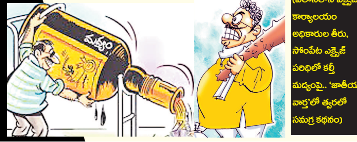
(పలాసలోని ఎక్సైజ్ కార్యాలయం అధికారుల తీరు, సాంపేట ఎక్సైజ్ పరిధిలో కల్తీ మద్యంపై.. 'జాతీయ వార్త'లో త్వరలో సమగ్ర కథనం)

వెళ్లిపోయారన్న విమర్శలు బహిరంగంగానే ఉన్నాయి. ఈ బాబు చేస్తున్న మద్యం సిండికేట్ వ్యాపారంలో టీడీపీ నేతలకు ఎవరెవరికి ఎంతెంత వాటా ఉందన్న దానిపై మాజీ మంత్రి సీదిరి అప్పలరాజు, వైసీపీ నేతలు పలుమార్లు బహిరంగ విమర్శలు కూడా చేశారు. మా ప్రభుత్వం.. అంతా మా ఇష్టం.. మమ్మల్ని ఎవరూ ఆపేది అనే ధోరణిలో ఈ బాబు ఉండడం, ఆయనకు వత్తాసుగా అధికార పార్టీ నేతలు ఉండడంతో ఎక్సైజ్, పోలీసు అధికారులు కూడా మౌన మునిలా వ్యవహరిస్తున్నారన్న గుసగుసులు పలాస నియోజకవర్గంలో వినిపిస్తోంది.