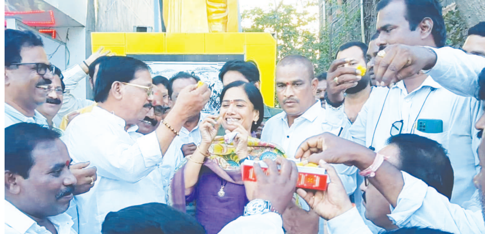
కల్పించడం దేశంలో అన్ని పార్టీలు ముక్కుతంకంగా హార్షం వ్యక్తం చేశాయని తెలిపారు. ఈ కార్యక్రమంలో రాష్ట్ర ట్రేడ్ ప్రమాపన్ కార్పొరేషన్