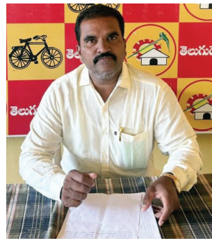
పార్లమెంట్ లో కూడా బిల్లు పెట్టి ఏకగ్రీవంగా ఆమోదం తెలిపినందుకు భారతదేశ ప్రధానమంత్రి నరేంద్ర మోడీ, కేంద్ర మంత్రులకు, పార్లమెంట్ సభ్యులకు ఈ బిల్లుకు మద్దతు తెలిపిన ఇతర పార్టీ సభ్యులకు నాయకులకు ధన్యవాదాలు తెలియజేస్తున్నానని తెలిపారు.