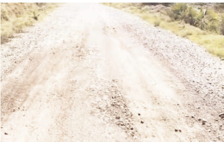
రోడ్డు నిర్మాణాన్ని పూర్తి చేసి, కిన్నెరవాడ-తొగిల గ్రామ ప్రజలకు ఈ ఇబ్బందుల నుంచి విముక్తి కల్పించాలని స్థానికులు, వాహనదారులు కోరుతున్నారు.

సారవకోట, ఏప్రిల్ 7 (వార్త): సారవకోట మండలం కిన్నెరవాడ, తొగిల గ్రామాలను కలుపుతున్న ఆర్. అండ్ బీ రోడ్డు దురుస్థితి స్థితికి చేరుకోవడంతో గ్రామస్థులు తీవ్ర ఇబ్బందులు ఎదుర్కొంటున్నారు. దశాబ్ద కాలంగా ఈ రోడ్డు పనులు పూర్తి కాకపోవడంతో శిథిలావస్థలోనే కొనసాగుతోందని స్థానికులు ఆరోపిస్తున్నారు. గత ప్రభుత్వంలో కొంతవరకు పనులు చేపట్టగా, ప్రస్తుత ప్రభుత్వంలో కూడా కొన్ని పనులు చేసినప్పటికీ రోడ్డు పూర్తిస్థాయిలో అభివృద్ధి చెందలేదని తెలిపారు. ఆధ్యాత్మిక ప్రాధాన్యం కలిగిన కిన్నెరవాడ గ్రామంలో వీరబ్రహ్మేంద్రస్వామి, ఆమ్మవారి జాతర ఉత్సవాలు ఘనంగా జరుగుతుంటాయి. అయితే రోడ్డు దుస్థితి కారణంగా భక్తులు, ప్రయాణికులు గ్రామానికి చేరుకునేందుకు తీవ్ర ఇబ్బందులు పడుతున్నారు. మండల, జిల్లా స్థాయి అధికారులు, ప్రజాప్రతినిధులు ఈ సమస్యను పట్టించుకోవడం లేదని గ్రామస్థులు వాపోతున్నారు. రోడ్డు గుంతలతో నిండిపోవడంతో ప్రయాణం ప్రమాదకరంగా మారినందున చెబుతున్నారు. ఇప్పటికైనా సంబంధిత అధికారులు స్పందించి