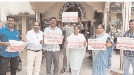
ఈ పాదయాత్ర ద్వారా తమ డిమాండ్లను ప్రభుత్వ దృష్టికి తీసుకెళ్లాలని నిర్ణయించుకున్నట్లు తెలిపారు.

నరసన్నపేట, ఏప్రిల్ 7 (వార్త): సమగ్ర సర్వ శిక్ష (సూర్యా) ఒప్పంద ఉద్యోగుల సమస్యలను పరిష్కరించాలని కోరుతూ మే 15న పాదయాత్ర నిర్వహించనున్నట్లు ఉద్యోగులు తెలిపారు. ఈ మేరకు మంగళవారం నరసన్నపేట ఎమ్మార్సీ కార్యాలయం ఆవరణలో వాల్ పోస్టర్లను విడుదల చేశారు. ఈ పాదయాత్ర విజయవాడలోని ప్రకాశం బ్యారేజీ నుంచి ప్రారంభమై లోకేశ్ నీవాసం వరకు కొనసాగుతుందని వెల్లడించారు. ఎన్నికల ముందు యువగళం పాదయాత్రలో లోకేశ్ ఇన్చీవ్ హామీలు ఇప్పటివరకు అమలు కాలేదని ఉద్యోగులు ఆవేదన వ్యక్తం చేశారు. తమ సమస్యలను ప్రభుత్వం చెంటనే పరిష్కరించాలని డిమాండ్ చేశారు.