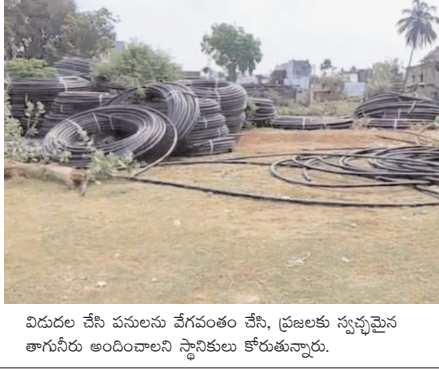
విడుదల చేసి పనులను వేగవంతం చేసి, ప్రజలకు స్వచ్ఛమైన తాగునీరు అందించాలని స్థానికులు కోరుతున్నారు.

నరసన్నపేట, ఏప్రిల్ 7 (వార్త): నరసన్నపేట మండలంలో ప్రతి ఇంటికి స్వచ్ఛమైన తాగునీరు అందించాలనే లక్ష్యంతో చేపట్టిన జలజీవన్ మిషన్ పథకం పనులు నత్తనడకన కొనసాగుతున్నాయి. మండలంలో మొత్తం 142 వసతుల గుర్తించి ప్రారంభించినప్పటికీ, ఇప్పటివరకు కేవలం 70 వసతులు మాత్రమే పూర్తయ్యాయి. మిగతా వసతులు నిలిచిపోయిన పరిస్థితి నెలకొంది. నిధుల కొరత కారణంగానే పనులు ఆలస్యమవుతున్నాయని అధికారులు పేర్కొంటున్నారు. అవసరమైన పైపులు, ఇతర మెటీరియల్స్ మండలంలోని దేశవానిపేట ప్రాంతంలో వదిలేయడం కూడా పనుల ఆలస్యానికి కారణమవుతోంది. ఈ కారణంగా గ్రామాల్లో తాగునీటి సమస్య పూర్తిగా పరిష్కారం కాలేక ప్రజలు ఇబ్బందులు పడుతున్నారు. ముఖ్యంగా వేసవికాలంలో నీటి అవసరం పెరిగిన సమయంలో పరిస్థితి మరింత ఆందోళనకరంగా మారింది. ఇప్పటికైనా సంబంధిత అధికారులు స్పందించి నిధులు