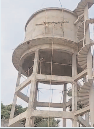
విడుదల చేసి పనులను వేగవంతం చేసి, ప్రజలకు స్వచ్ఛమైన తాగునీరు అందించాలని స్థానికులు కోరుతున్నారు.

నరసన్నపేట, ఏప్రిల్ 7 (వార్త): నరసన్నపేట మేజర్ పంచాయతీలో ప్రజల దావోని తీర్చేందుకు ఎమ్మెల్యే బి.గృ.రమణమూర్తి చొరవతో దేశవానిపేటలో రక్షిత మంచినీటి పథకం ముంజూరైంది. ఈ పథకం కోసం ప్రభుత్వం రూ. 68 లక్షల నిధులను కేటాయించింది. సుమారు 1.50 లక్షల లీటర్ల సామర్థ్యంతో నిర్మిస్తున్న ఈ పథకం పనులు ఇంకా పూర్తి కాలేదు. పనులు ముందుకు సాగకపోవడంతో స్థానికులు తాగునీటి కోసం తీవ్ర ఇబ్బందులు ఎదుర్కొంటున్నారు. నిధుల విడుదలలో ఆలస్యం కావడం వల్లనే పనులు నిలిచిపోయాయని నిర్మాణదారులు పేర్కొంటున్నారు. వేసవికాలంలో నీటి అవసరం పెరిగిన ఈ సమయంలో పథకం పూర్తి కాకపోవడం ప్రజలను ఆందోళనకు గురిచేస్తోంది. ఇప్పటికైనా సంబంధిత అధికారులు స్పందించి నిధులు విడుదల చేసి పనులను వేగవంతం చేసి, ప్రజలకు తాగునీటి సమస్యను శాశ్వత పరిష్కారం కల్పించాలని స్థానికులు కోరుతున్నారు.