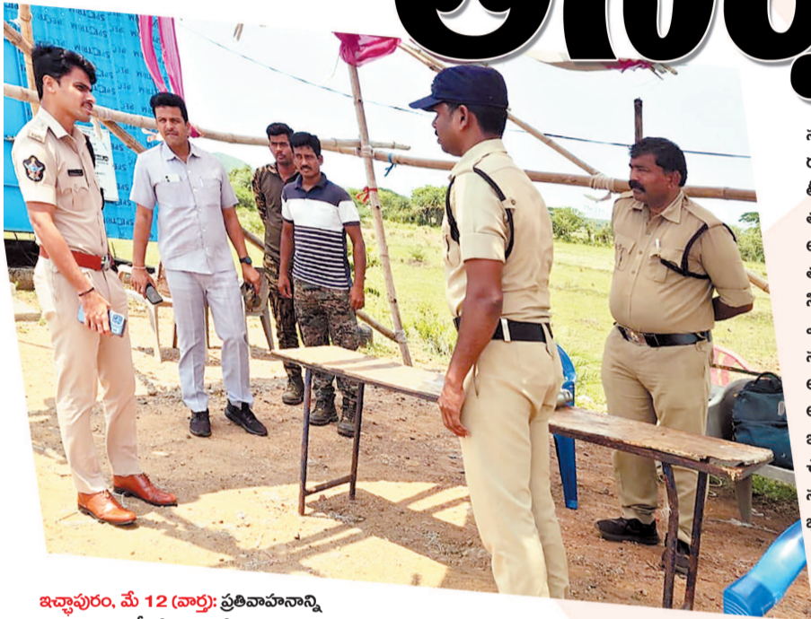
ఇచ్చాపురం, మే 12 (వార్త): ప్రతి వాహనాన్ని క్షణంగా తనిఖీ చేయడంతో పాటు