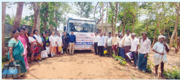
మండసలో విజయవంతమైన ఉచిత నేత్ర వైద్య శిబిరం