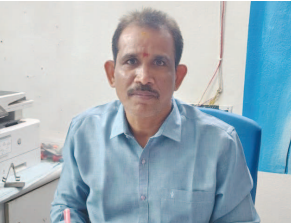
ప్రవేశపరీక్షల్లో సమయానికి హాజరై అడ్మిషన్ ప్రక్రియ పూర్తి చేసుకోవాలని పాఠశాల యాజమాన్యం కోరింది.

సూచించారు. అడ్మిషన్ కోసం ఎంపికైన విద్యార్థులు ట్రాన్స్ఫర్ సర్టిఫికేట్ లేదా రికార్డు షీట్, స్టడీ సర్టిఫికేట్, విద్యార్థి మరియు తల్లిదండ్రుల ఆధార్ కార్డు జి.కా.ప్రకటనలు, మూడు పాస్పోర్ట్ సైజు ఫోటోలు, కుల ప్రువీకరణ పత్రం, అత్యంత ప్రువీకరణ పత్రం, సర్టిఫికేట్ ఫోర్మర్ కవర్ తదితర పత్రాలతో జూన్ 1, 2026లోపు పాఠశాలకు హాజరుకావాలని తెలిపారు. అడ్మిషన్ ప్రక్రియలో ఎలాంటి ఇబ్బందులు ఎదురైనా పాఠశాల ప్రిన్సిపల్ ను సంప్రదించాలని సూచించారు. పూర్తి వివరాల కోసం 9440322964 నంబర్ ను సంప్రదించవచ్చని పేర్కొన్నారు. విద్యార్థులు గడువు తేదీని దృష్టిలో ఉంచుకుని అవసరమైన