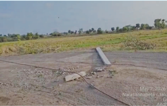
May 2, 2026 Narasannapeta, Julu G. Andri

జలుమూరు, మే 2 (వార్త): గుగ్గిలి గ్రామ సమీపంలో రోడ్డుకు అడ్డంగా విద్యుత్ స్తంభం పడిపోవడంతో ప్రమాదకర పరిస్థితులు నెలకొన్నాయి. శుక్రవారం రాత్రి వీధిని భారీ గాలులకు ఈ స్తంభం కూలిపోయినప్పటికీ, ఇప్పటివరకు తొలగించకపోవడం స్థానికుల్లో ఆందోళన కలిగిస్తోంది. వాహనాలు రోడ్డు పక్కగా ప్రయాణం చేస్తుండగా, స్తంభానికి విద్యుత్ తీగలు కూడా అనుసంధానంగా ఉండటం వల్ల ఎప్పుడైనా ప్రమాదం జరిగే అవకాశముందని ప్రజలు భయపడుతున్నారు. ముఖ్యంగా రాత్రి వేళల్లో ఈ పరిస్థితి మరింత ప్రమాదకరంగా మారతేందని వారు చెబుతున్నారు. సంబంధిత విద్యుత్ శాఖ అధికారులు తక్షణమే స్పందించి స్తంభాన్ని తొలగించి రహదారిని సురక్షితంగా మార్చాలని స్థానికులు కోరుతున్నారు. ప్రస్తుత పరిస్థితిపై అధికారులు వివరణ ఇవ్వాలని అవసరం ఉందని వారు అంటున్నారు.