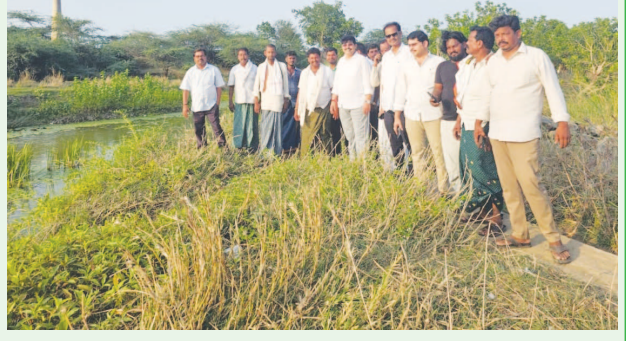
అవగాహన అంటూ ప్రశ్నించారు.

ఇదేవల కేంద్రమంత్రి రామ్మోహన్ నాయుడు ఇచ్చాపురం నియోజకవర్గం లో కలెక్టర్ తో కలిసి నిర్వహించిన ప్రజాసభలో లో పంచాయతీ లలో బట్టి లు వెయ్యాలని, కంటి పోల్స్ వెయ్యాలని, సిఎంఐ రోడ్ లు కావాలని అడిగి కౌన్ సాగు కోల్పోయిన వ్యవసాయ భూములకు నీరందించే ప్రాజెక్టు లు కావాలని, ఉపాధి ప్రాజెక్టు లు కావాలని అడగలేకపోవడం ఎంఎల్ఎ నియోజకవర్గం లోని ప్రజల పట్ల శ్రద్ధ లేని తనానికి, నిలక్షానికి నిదర్శనమని శ్యాంప్రసాద్ తార్కారం వహించారు. కేంద్ర తరపున ఎంఎల్ఎ కి తాను చెయ్యవలసిన స్యాం పనులుకు వినతునిస్తారా? ఇదేనా మీ