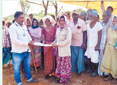
ఉపాధి హామీ పనుల పరిశీలన