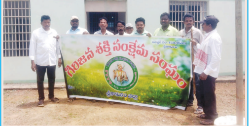
మందసలోనే 'ఐటీడీపీ' ఏర్పాటు చేయాలి