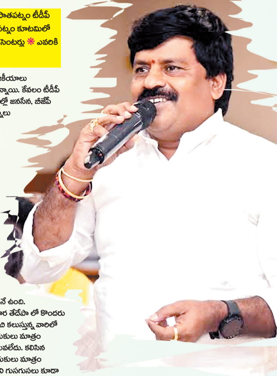
2029 ఎన్నికల్లో కూడా ఘోర పరాజయం తప్పదని రాజకీయ వర్గాలు హెచ్చరిస్తున్నాయి.